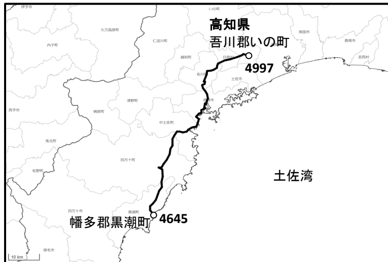
水準点標高断面図