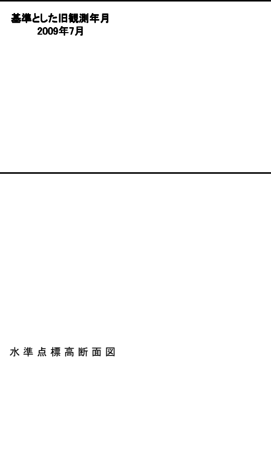
水準点標高断面図